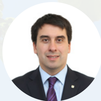
Johann Allesch Peñalillo CONTRALOR