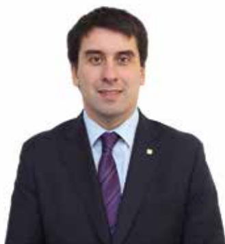
Johann Allesch Peñalillo Contralor